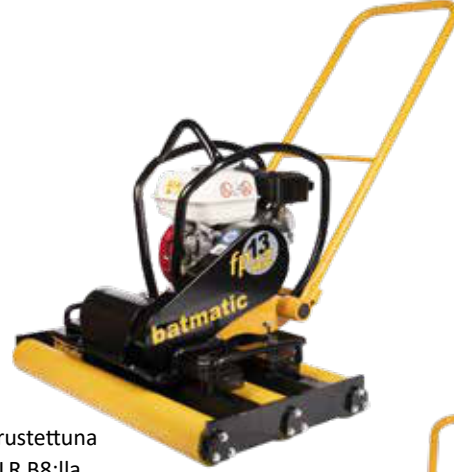
1342R varustettuna BATROLLER B8:lla