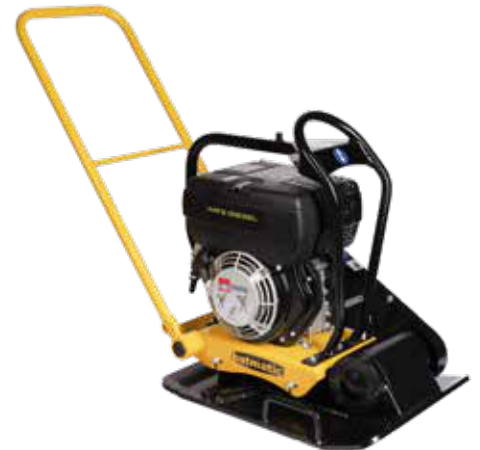
FP2150 R diesel