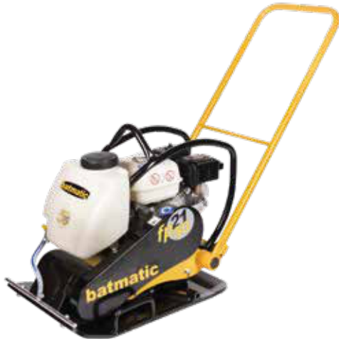
FP2150 W bensa