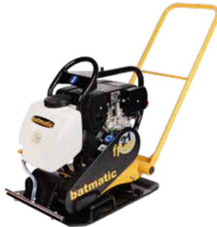
FP2150 W diesel

Dieselmallissa on kaasuvipu kiinteillä esiasetuksilla, joka mahdollistaa tasaisen etenemisnopeuden